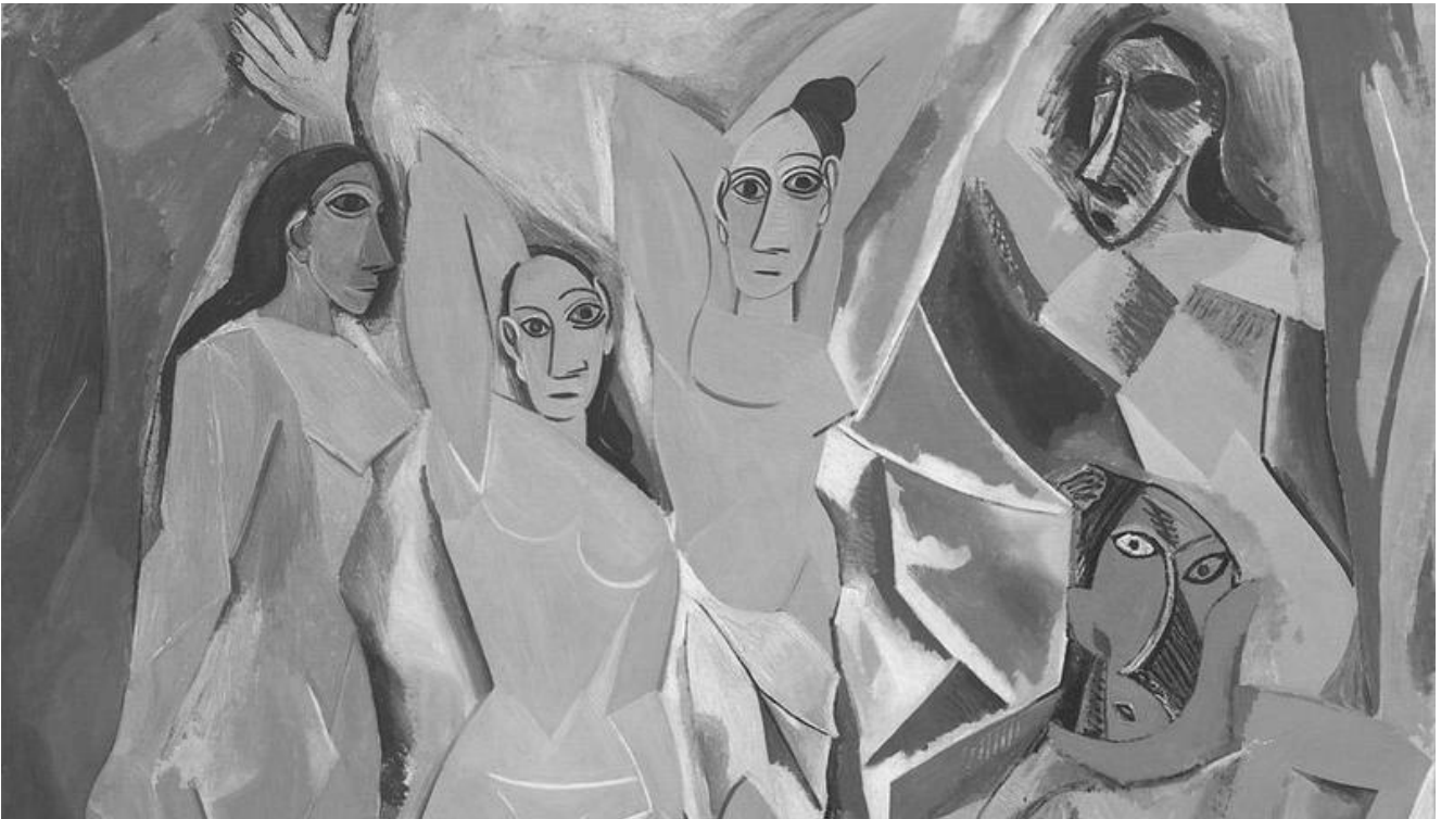
Pablo Picasso, 1907, Les-demoiselles-davignon-Ausschnitt, MoMA, New York City