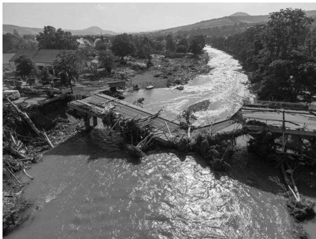
Ahrtor Brücke in Ahrweiler, Ufer links und rechts bebaut

man beachte die Bauweise die bei extremem Hochwasser, die Hauptwassermassen der Flut an der linken unbebauten Brückenseite vorbeiführt.