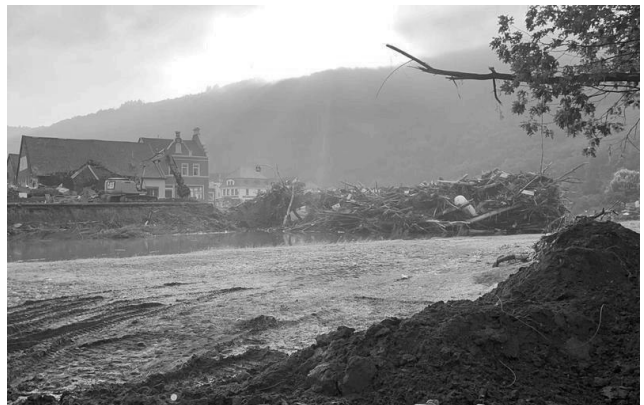
Treibgut an der Nepomukbrücke Rech