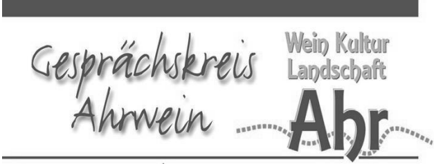
Der Gesprächskreis Ahrwein