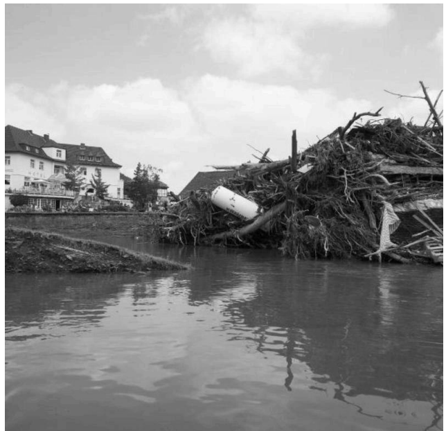
Treibgut an der Nepomukbrücke Rech

Zum konkreten Fall der Brücke am ehemaligen Weinbauverein Dernau: Seit vielen Jahrzehnten -spätestens seit 2016- ist bekannt, dass in Dernau mit der durch den Bahndamm seit 1910 künstlich geschaffenen trichterförmigen Engstelle etwas gebaut worden war, was eine Scheinsicherheit bei kleineren Hochwässern schuf, aber bei einem Wasserstand von spätestens ca. 4 m am Pegel Altenahr dazu führt, dass der Fluss über den Bahndamm ins Dorf fließt. Vielfach wurde in der Vergangenheit im Bereich des Weinbauvereins die Brücke immer wieder