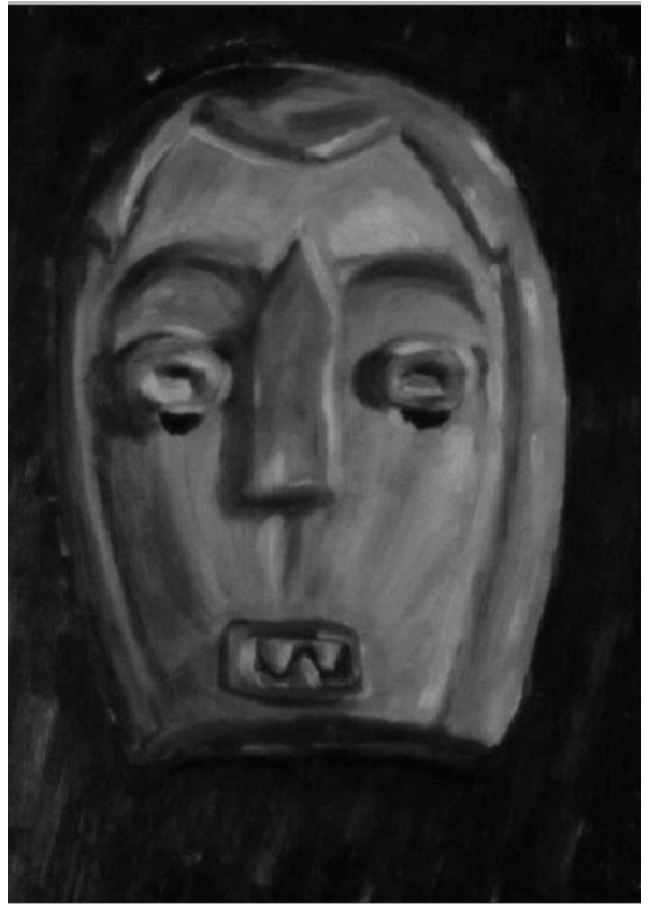
Gemälde nach einer afrikanischen Maske