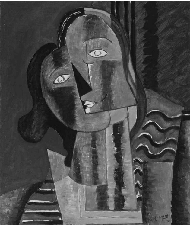
Georges Braque, Tête de femme II, 1930