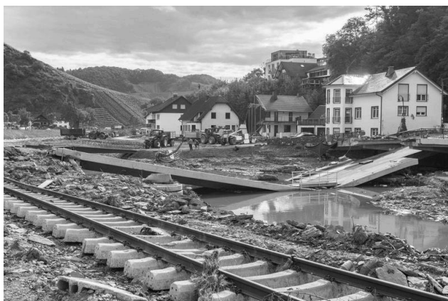
Im Ernst? Hier will die SGD Nord die Brücke wiederaufbauen? Bessere Lösungen liegen auf der Hand. Weinbau Brücke in Dernau.