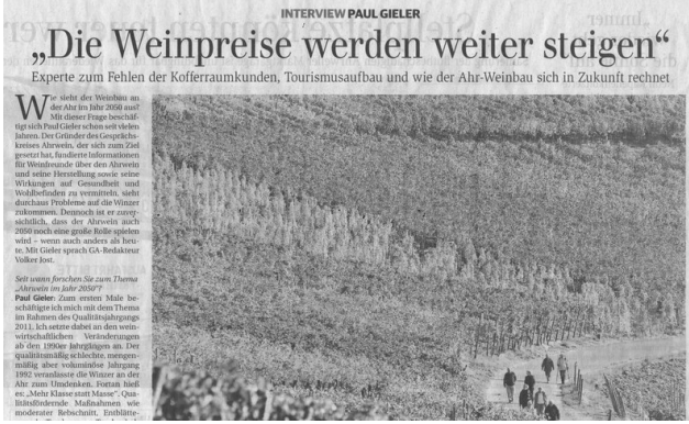
Paul Gieler im General-Anzeiger Teil 1