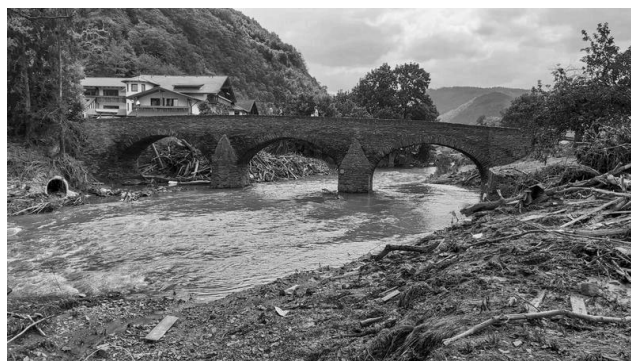
Treibgut an der Steinbergsmühle in Dernau, Foto: Bernd Schreiner 22. Juli 21