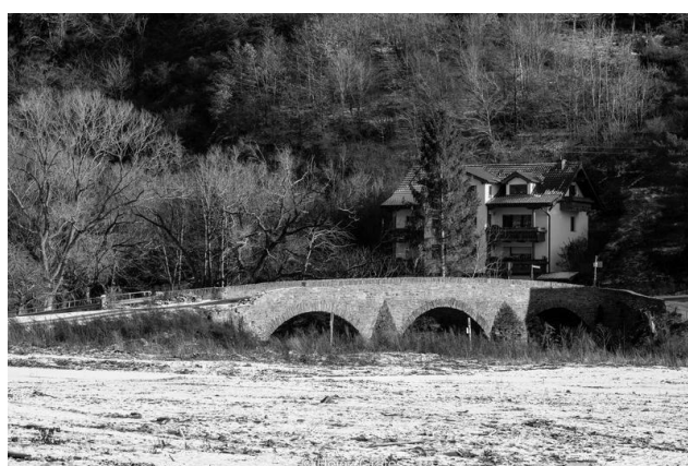
Steinbergsmühle in Dernau, Foto: Heinz Grates Dezember 2022;