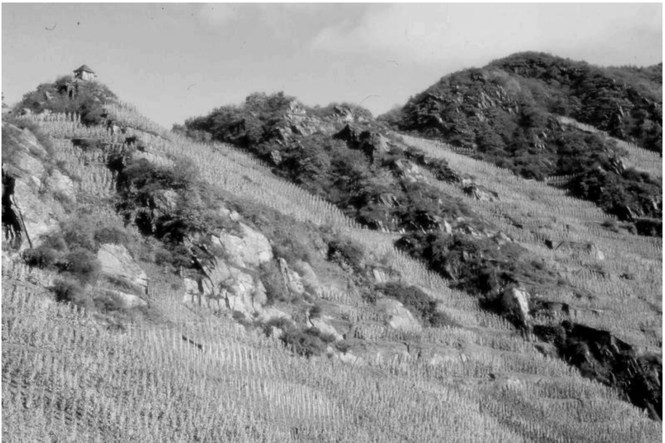
Steillagen-Weinbau im Ahrtal bei Mayschoß