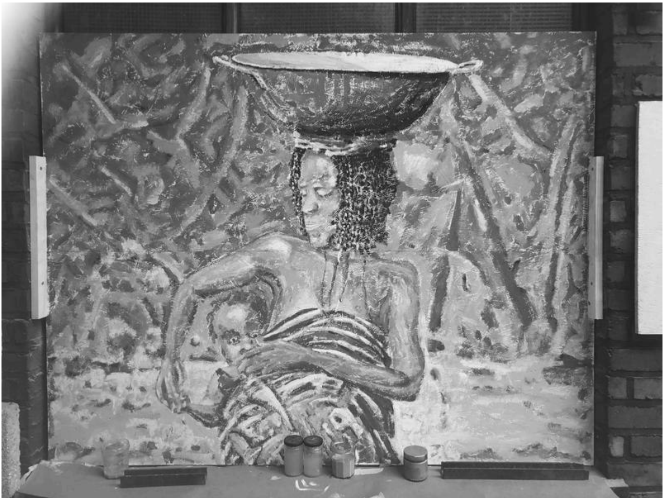
afrikanische Mutter mit Kind (unfertiges Gemälde, Matthias Bertram, Ahrweiler)