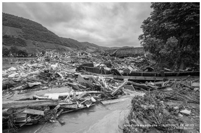
Treibgut an der Steinbergsmühle in Dernau 16. Juli 21