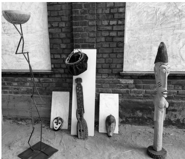
Testhängung von Masken und Skulpturen vor dem "Rhine-Ahrt"-Atelier

Neben dem Thema Afrika, finden sie natürlich ein Vielzahl von Gemälden und Drucken zur Landschaft und zu den