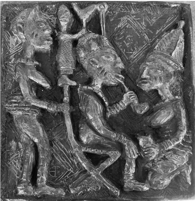
Bronze Relief von Matthias Bertram von einer Szene, wie sie an einer Haustür im Königreich Benin dargestellt wurde.