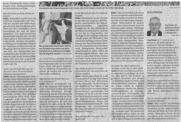
Paul Gieler im General-Anzeiger Teil 2