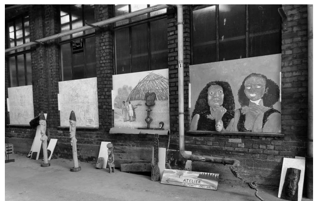
Aussenbereich Atelier "Rhine-Ahrt" auf dem ReKoFa-Gelände

Aber: Preiswerte Räumlichkeiten für den Künstler sich auszutoben, Anlieger werden nicht von den Geräuschen der Kettensäge, vom Geruch von frischer Ölfarbe und anderem belästigt; die Möglichkeit auch grossformatige Bilder zu malen ist gegeben, im Ateler und in den Aussenräumen.