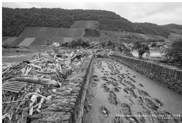
Treibgut an der Steinbergsmühle in Dernau, Foto: Bernd Schreiner 16. Juli 21

Insofern dürften die oben zitierten Aussagen