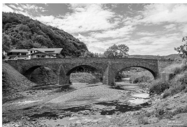
Steinbergsmühle in Dernau 06. Juni 22